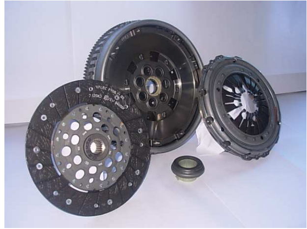
Original Kit with Dual Mass Flywheel

This clutch kit, including rigid flywheel, has been designed by Valeo engineers as a replacement to the original clutch kit & dual mass flywheel. Despite being visually different from the original clutch (including a rigid flywheel & a dampened disc instead of a dual mass flywheel & a rigid disc), Valeo guarantees that this clutch kit, if correctly installed on the vehicle, will give you full satisfaction in terms of quality, reliability & durability.