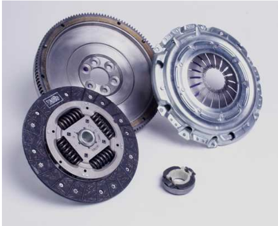
Valeo Kit 4-pcs with Rigid Flywheel

Zestaw 4-elementowy z sztywnym kołem zamachowym Rijit volan içeren 4'lü takım 4dílná spojková sada s pevným setrvačnickem 4-részes kuplungszett rögzített lendkerékkel Комплект сцепления с жестким маховиком Комплект 4 части с пльтен маховик Σετ 4 τεμαχίων με συμπαγές βολάν